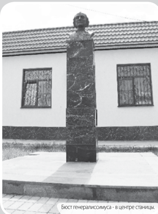
Бюст генералиссимуса - в центре станицы.