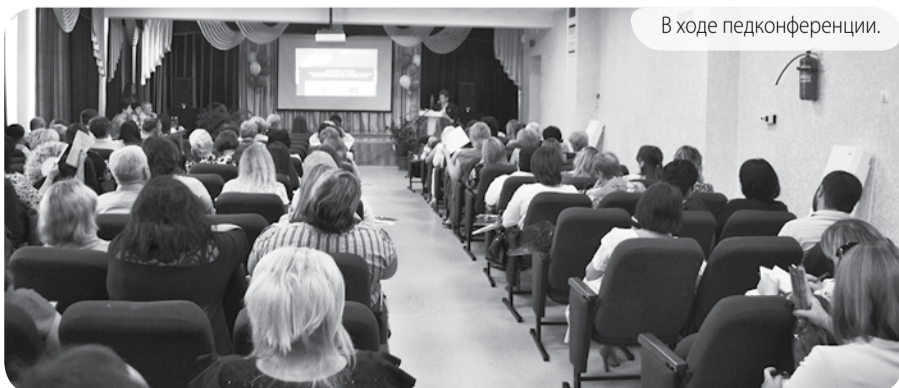
В ходе педконференции.