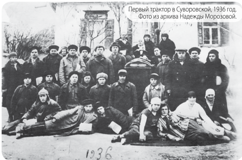
Первый трактор в Суворовской, 1936 год.

С 1928 по 1934-й станица Суворовская входила в Ессентукский район. С 30 августа 1930 года в состав Ессентукского района входили города Ессентуки и Железноводск, десять сельских советов (Ессентукский, Ново-Благодарненский, Боргустанский, Бекешевский, Суворовский, Гражданский, Сунженский, Юцкий, Этоцкий и Вин-Сады). Упразднен в 1934 году. Из Ессентукского района был выделен Суворовский район, а город Ессентуки преобразован в горрайон с пригородной зоной.