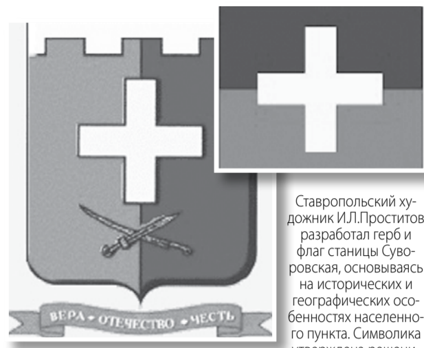
Ставропольский художник И.Л.Проститов разработал герб и флаг станицы Суворовская, основываясь на исторических и географических особенностях населенного пункта. Символика утверждена решением Совета депутатов Суворовского сельсовета 20 октября 2003 года, внесена в Геральдический реестр РФ 31 октября 2006 года.

округа, только 5 семей вернулись в Грузию. Переселенцам на постройку жилых домов было выделено по 500 рублей на каждое домохозяйство независимо от числа членов семьи. К моменту переселения многие эти деньги были израсходованы. (Постановление Сельхоз банка СССР: Сельхоз банк 3/08 – 1938 года № 305 В).