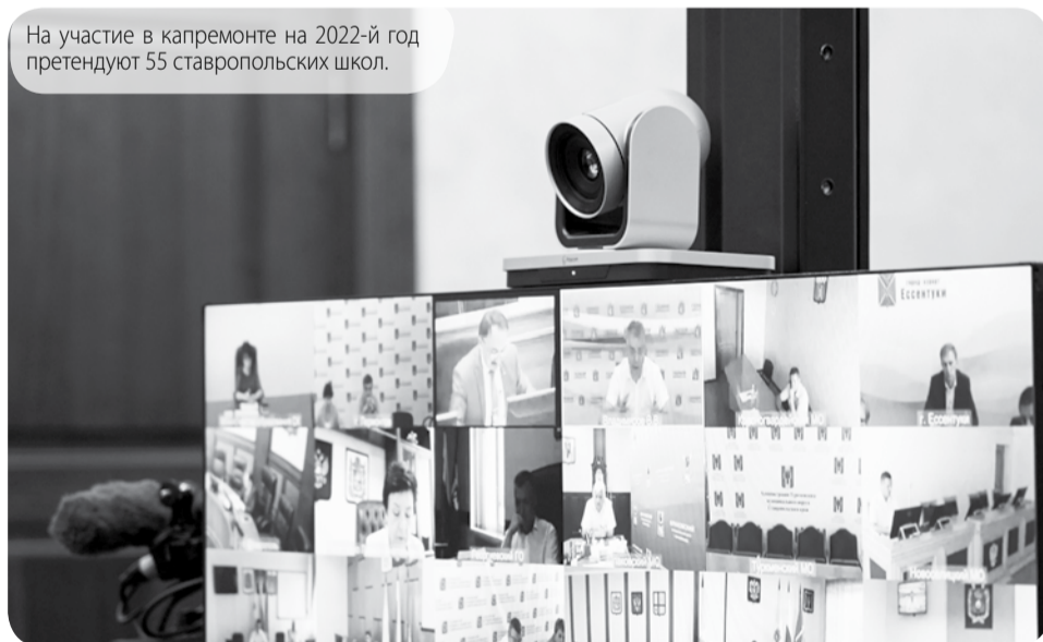
Управление по информационной политике аппарата правительства Ставропольского края (по материалам пресс-службы губернатора Ставропольского края, ОИВ Ставропольского края).

Ставропольский край занял третье место в России по использованию метана в качестве моторного топлива.