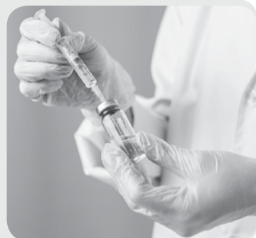
Управление по информполитике аГСК.

От гриппа планируется привить 60% жителей Ставропольского края. В первую очередь это граждане группы риска – дети, пожилые, с хроническими заболеваниями, медики, работники образовательной сферы и сферы услуг.