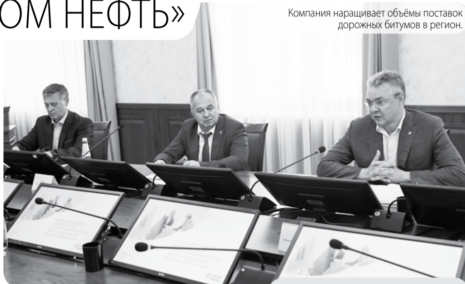
Компания наращивает объёмы поставок дорожных битумов в регион.

– Считаю очевидными наши достижения в сфере