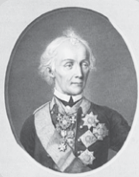
А.В. СУВОРОВ. Портрет работы Н.И. Уткина, гравированный с портрета 1800 года. 1818 год.

По определению Епархиального Начальства, храм был освящён Благодинным священником Матвеем Белоусовым 4 ноября 1902 года в честь второго празднования Казанской иконы Божьей Матери. В день освящения собор принял несколько тысяч человек. По завершении божественной литургии, проведен крестный ход. Стены церкви были розово-красные, увенчанные золотыми куполами и крестами.