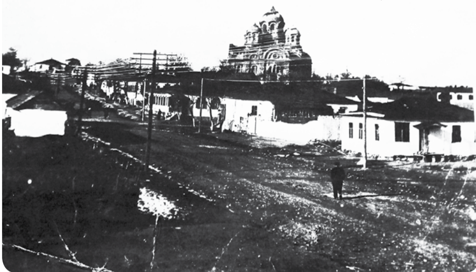
Главная улица Суворовской в дореволюционные годы.

К середине 1920-х гг. было покончено с вылазками остатков «бело-зелёных». В 1924 году станица стала центром Суворовского района. Северо-Кавказского края. Район существовал в 1924-1928, и позднее – в 1934-1957 годах.